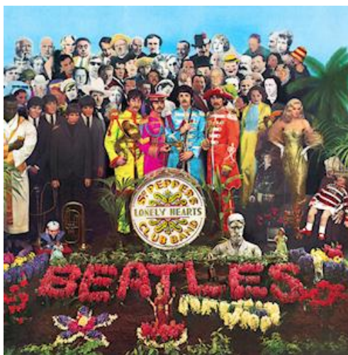
Peter Blake, Sgt. Pepper's Lonely Hearts Club Band, 1967