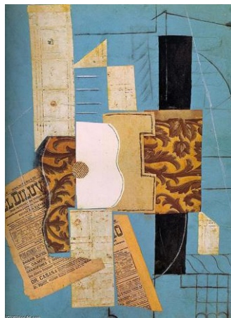
Picasso, 'De Gitaar' (1913)

De collagetechniek is sindsdien verder geëvolueerd tot een autonoom geven binnen de beeldende kunst. Een werk dat vaak beschouwd wordt als het allereerste iconische kunstwerk uit de geschiedenis van de pop art is Richard Hamilton's 'Just what is it that makes homes so different, so appealing?' of de platenhoes van de Beatles 'Sgt. Pepper's Lonely Hearts Club Band' van Peter Blake.