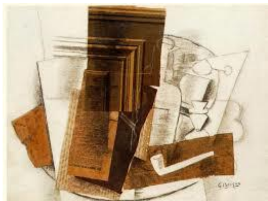
Braque, 'Fles' (1914)

Collage als techniek is ontstaan in de periode 1910-1912 toen een aantal kubisten (o.a. Pablo Picasso, George Braque en Juan Gris) andere materialen dan verf (behangpapier, kranteknipfels, karton, hout) gingen gebruiken in hun schilderijen.