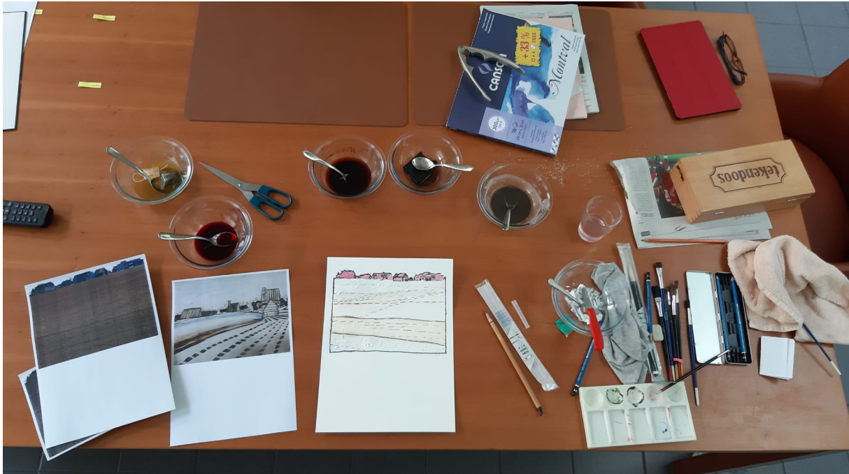
Werktafel van Kristin thuis

Hierbij een foto van een Vlaams landschap - regio Brussel –