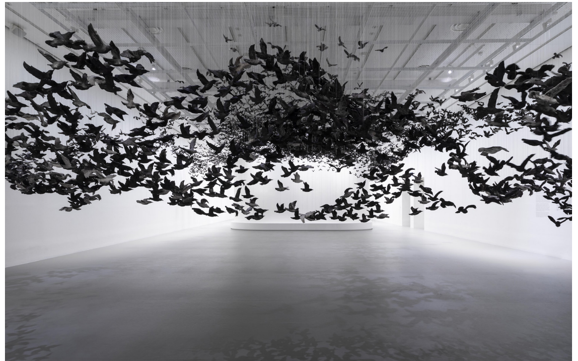
Cai Guo-Qiang murmuration

https://cfileonline.org/category/design/