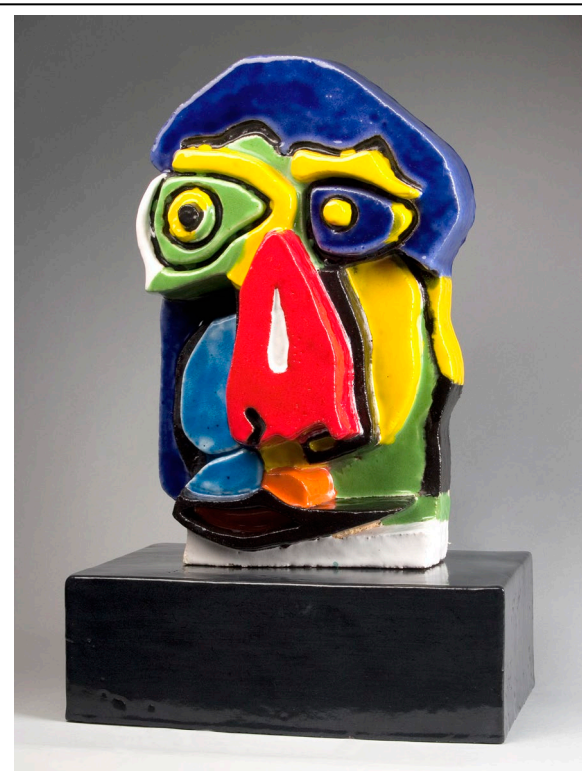
Karel Appel, Tête, 1978, aardewerk, uitgevoerd bij Struktuur 68, Den Haag, h. 56,6 cm

https://www.prinsessehof.nl/collectie/modern-hedendaags-en-design/babs-haenen/