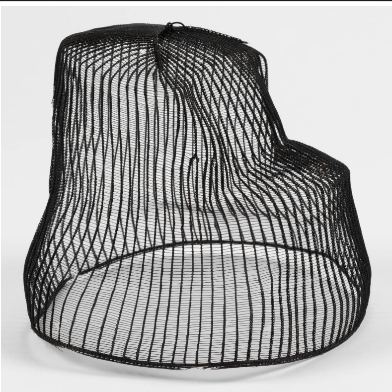
Tang geon, indoor hat, 1850 – 1910, Korea

The V&A is the world's leading museum of art and design, housing a permanent collection of over 2.3 million objects that span over 5,000 years of human creativity. The Museum holds many of the UK's national collections and houses some of the greatest resources for the study of architecture, furniture, fashion, textiles, photography, sculpture, painting, jewellery, glass, ceramics, book arts, Asian art and design, theatre and performance.