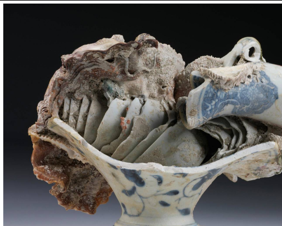
Sea sculpture 1725 Vietnam

https://www.vam.ac.uk/collections/ceramics#articles